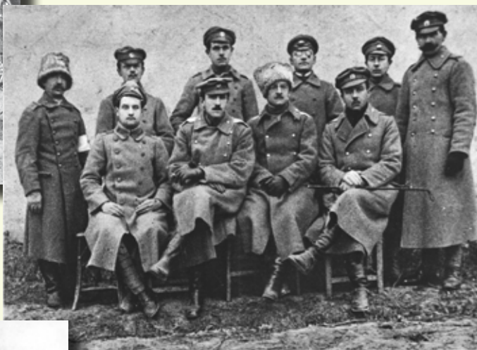
7. čs. strelecký pluk TATRANSKÝ, r. 1917