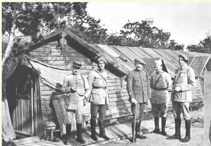
Veliteľ čs. brigády so štábom vo Francúzku, r. 1918