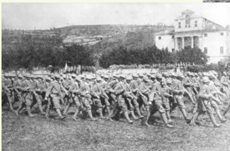
Pochod čs. divízie pri prehliadke v Orgianu