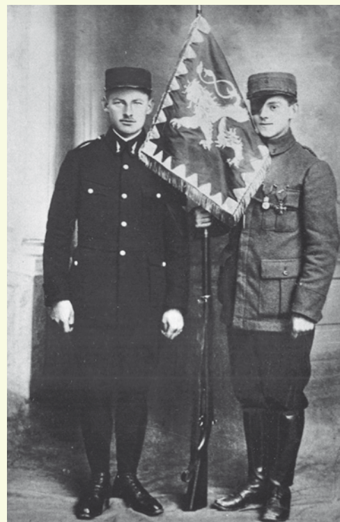
Zástava roty Nazdar vo Francúzku, r. 1914

Zo zajatých slovenských a českých vojakov rakúskej armády a z dobrovoľníkov vo Francúzsku, Rusku a Taliansku boli vytvorené bojaschopné jednotky, ktoré zasiahli do bojov v závere prvej svetovej vojny. Po jej skončení sa légie podieľali na zabezpečení hraníc novovytvoreného Československa a stali sa jedným zo základov, na ktorých sa vytvorila armáda medzivojnového Československa.