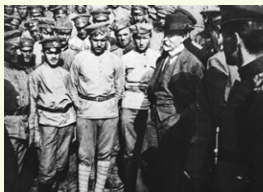
T. G. Masaryk s čs. legionármi v Rusku, r. 1917